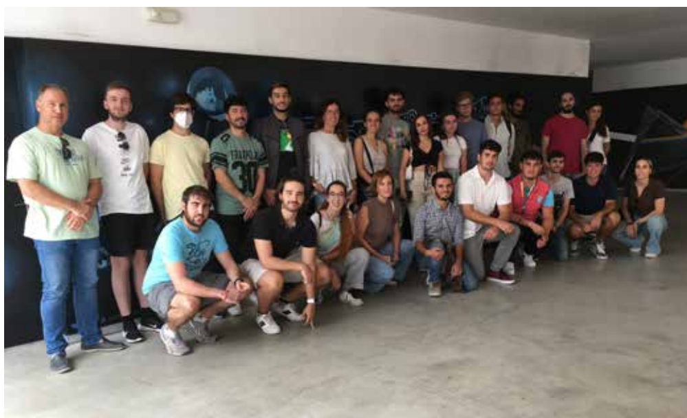
Figura 3. Detalle del Seminario 1 TRAMITACIÓN, INGENIERÍA Y CERTIFICACIÓN DE PROYECTOS DE HIDRÓGENO RENOVABLE. Díptico del curso (arriba). Foto de familia (abajo).