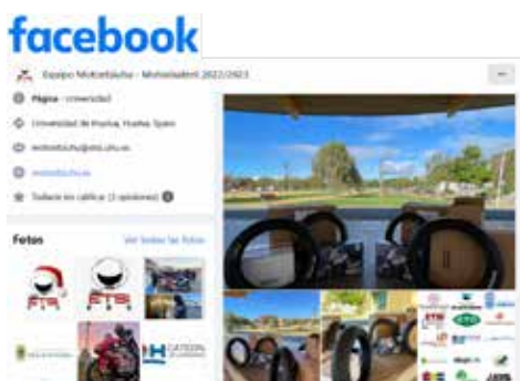
Figura 5. Detalle del perfil en red social del equipo MotoETSI-UHU. Imagen inferior derecha: logo entidades colaboradoras (Cátedra Gabitel sobre el Hidrógeno).