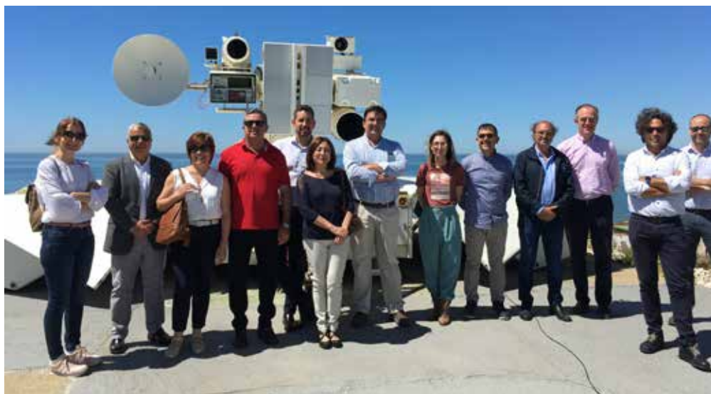
Figura 13. Foto de grupo durante la visita técnica a INTA de la I Jornada InterCátedra 2023.