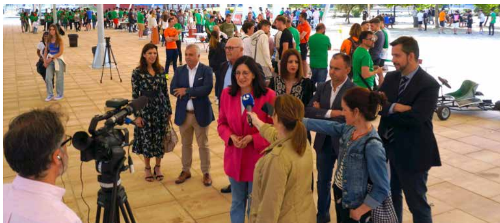
Figura 4. Imagen de la celebración de la actividad SURBANRACE 2023, co-financiada por la Cátedra Gabitel sobre el Hidrógeno.