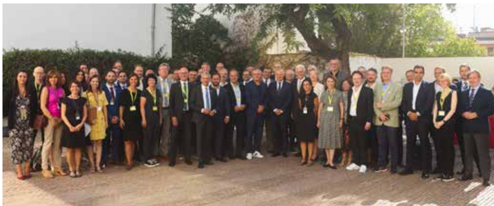
Figura 16. Foto de familia del encuentro.

El encuentro tuvo lugar en la sede del Ayuntamiento de Tomares, localidad donde Gabeltel Ingenieros tiene sus segundas oficinas.