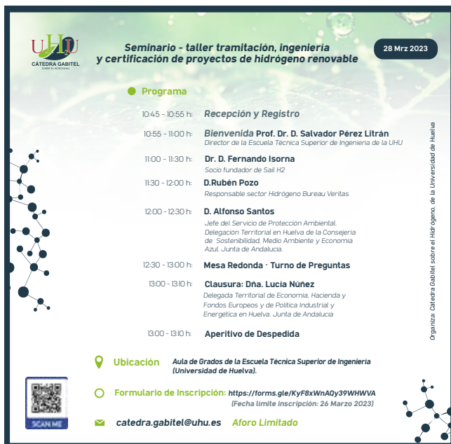
Figura 2. Detalle del Seminario 1 TRAMITACIÓN, INGENIERÍA Y CERTIFICACIÓN DE PROYECTOS DE HIDRÓGENO RENOVABLE. Foto de familia (arriba) y programa del seminario (izquierda).