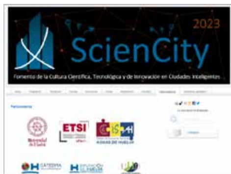
Figura 6. Imagen web congreso internacional ScienCity 2023.