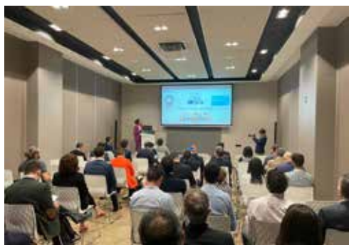
Figura 8. Momento de la intervención de la Directora de la Cátedra en el PMH2 2023.