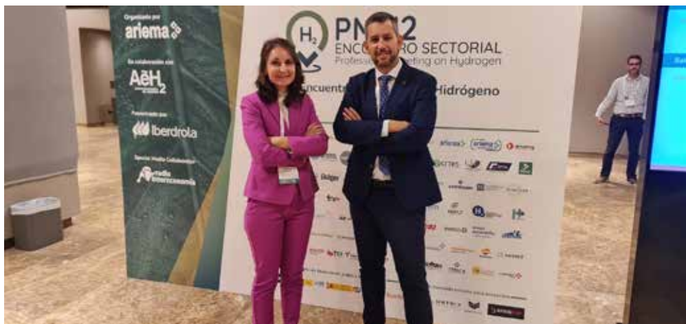
Figura 7. Representación de la Cátedra Gabitel en el PMH2 2023.