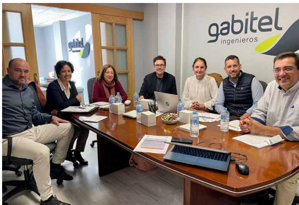
Figura 1. Imagen de uno de los Consejos de Cátedra celebrados durante 2023 en las dependencias de Gabbitel Ingenieros S.L.