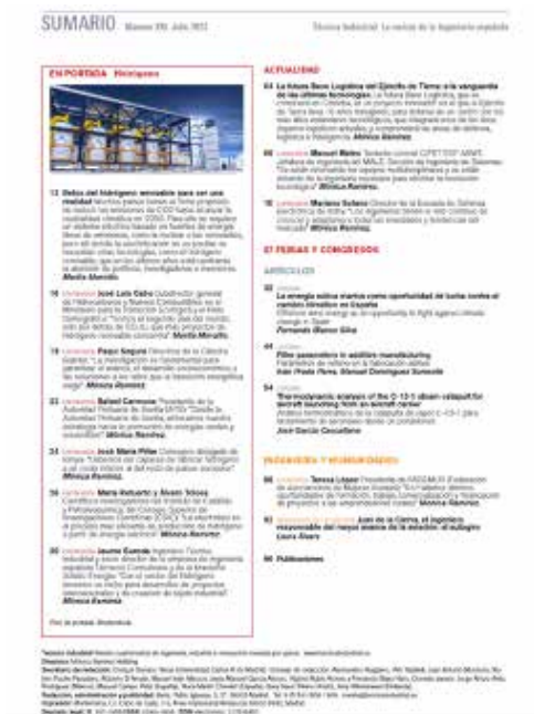
Figura 14. Imagen de portada (izquierda) y de sumario (derecha) del número 335 de julio de 2023 de la Revista Técnica Industrial.